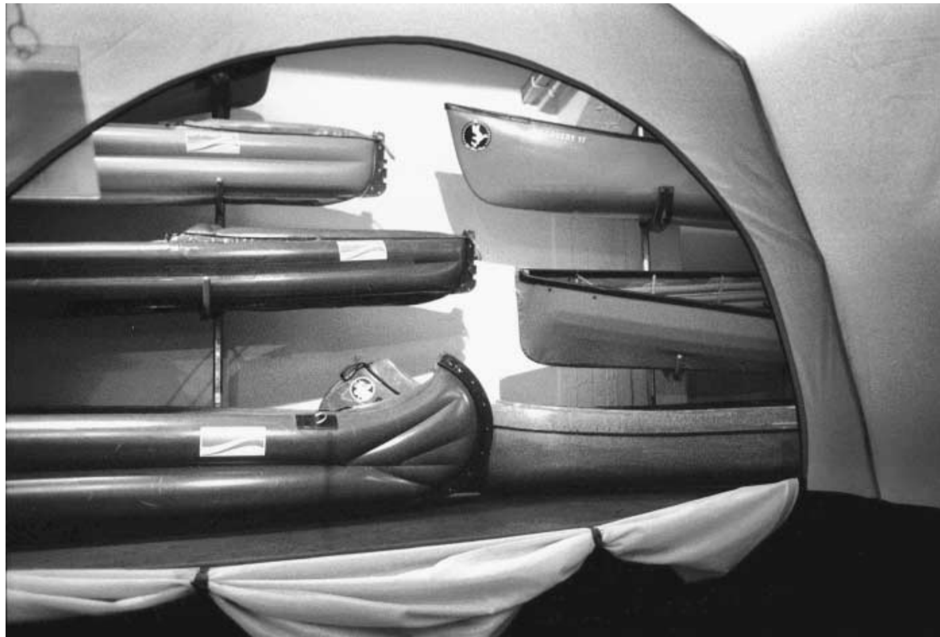
Für 42 000 Paddelkilometer gibt es die Ehrennadel: Das Basiccamp des „Globetrotter“ im Keller bietet alles für ein Leben auf dem Wasser

Mensch und Material verbanden sich in diesen Fällen zu einer effizienten Einheit, die wagemutig Reisenden gern als Vorbild empfohlen wird. Etwa für die, die sich mit kleinem Gepäck aufmachen, ihren Selbstbehauptungswillen in der Fremde zu erproben. Und weil es bei solchen Reisen darum geht, leicht beladen mit eigener Kraft voranzukommen, gilt immer noch das Fahrrad als zünftigstes Vehikel.