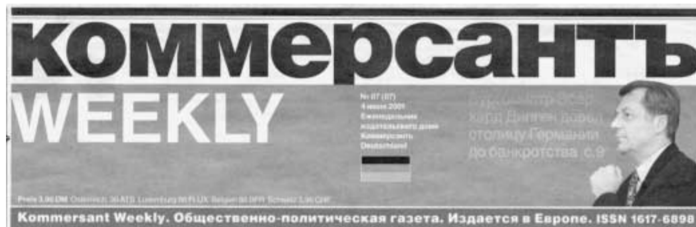
4. Juni 2001: „Bürgermeister Eberhard Diepgen trieb die deutsche Hauptstadt in den Ruin.“